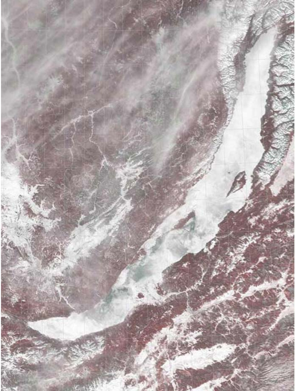
Le lac Baïkal vu de l'espace au cours des saisons (hiver : février)