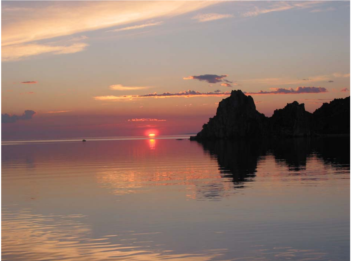
Le lac Baïkal