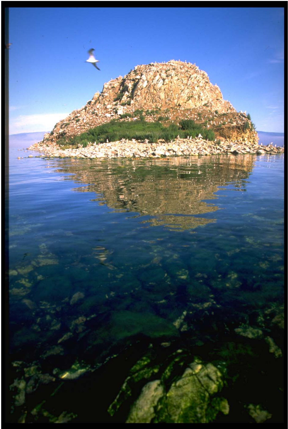
Le lac Baïkal