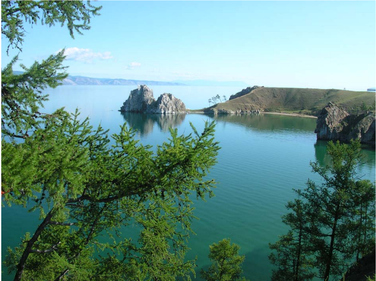
Le lac Baïkal