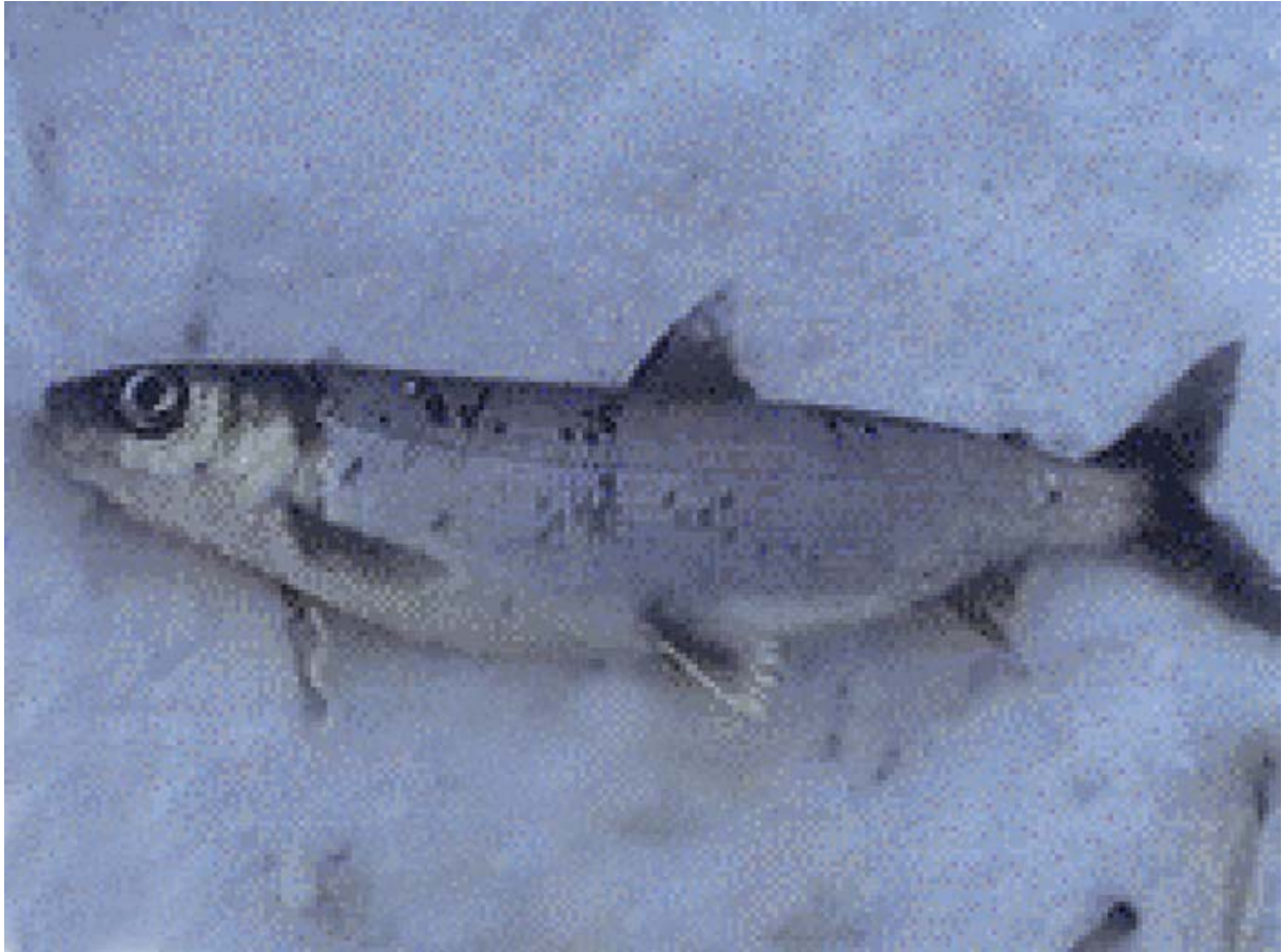
L'omoul est le poisson le plus pêché du lac depuis des siècles.