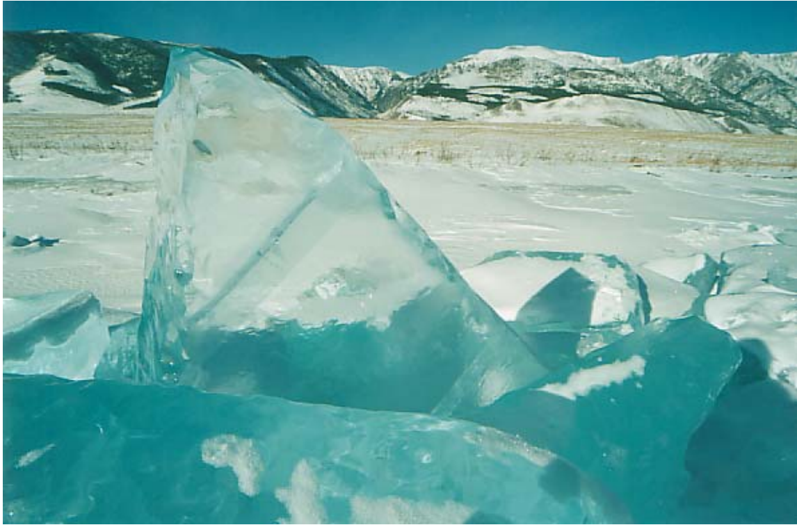
Glace du lac Baïkal