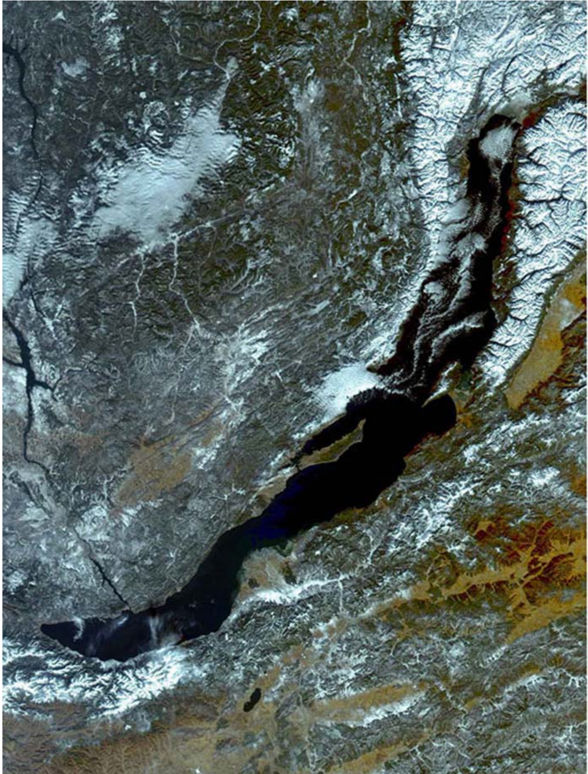
Le lac Baïkal vu de l'espace au cours des saisons (automne)