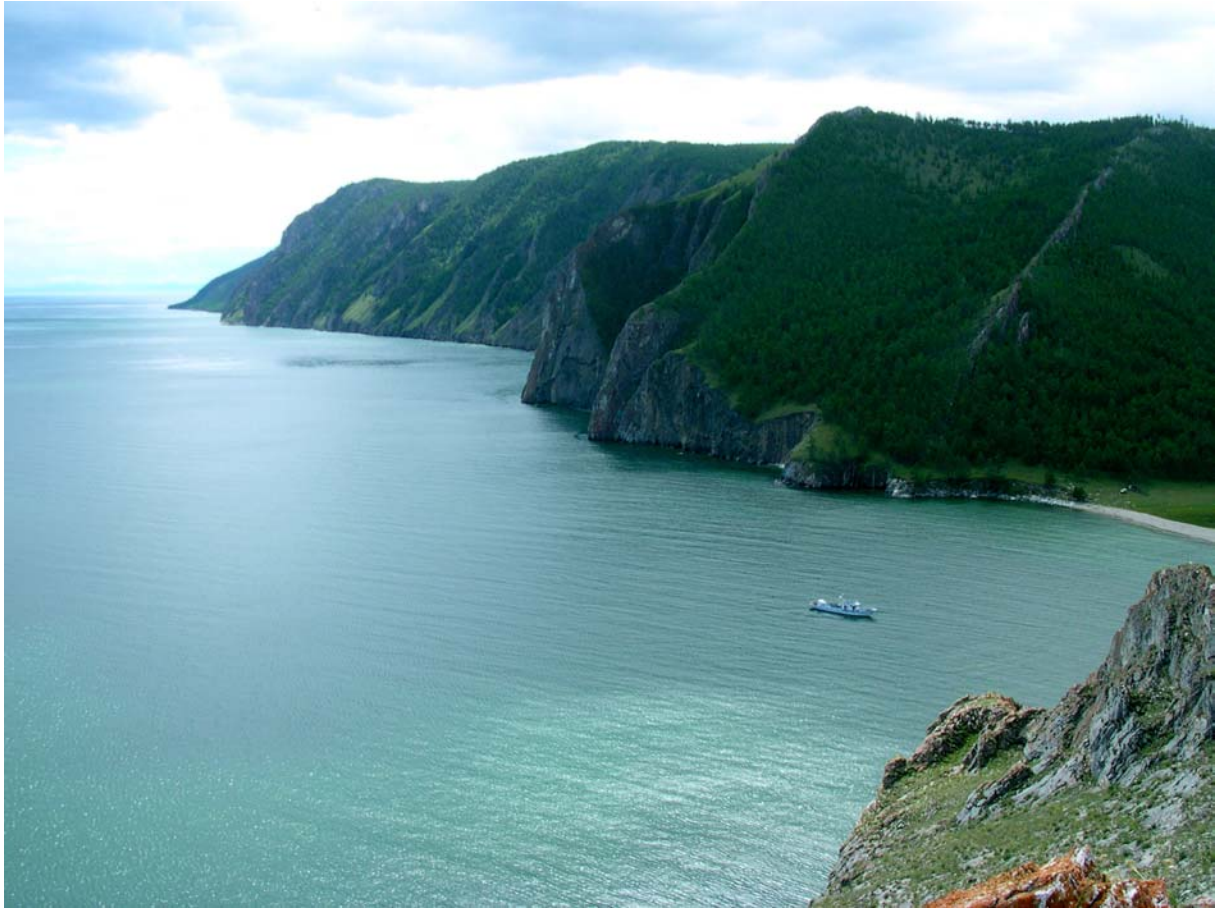
Le lac Baïkal