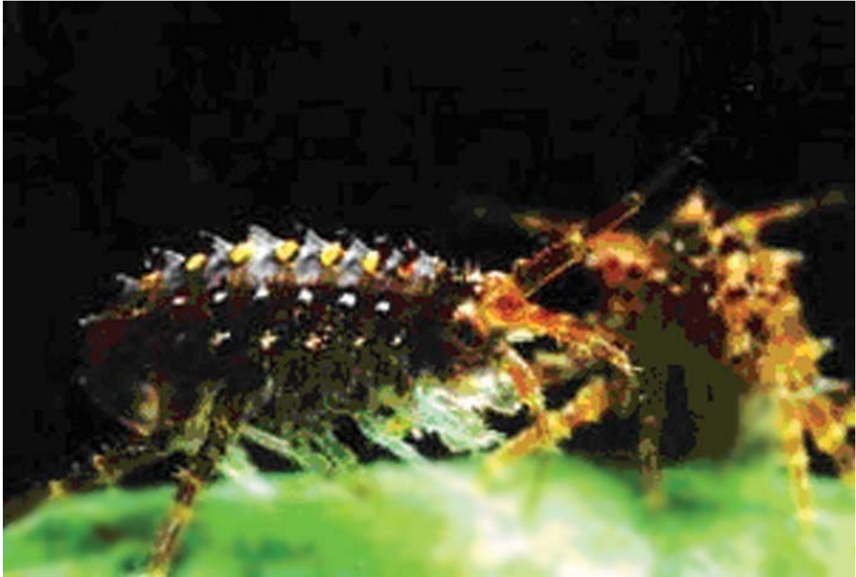
Gammare géant