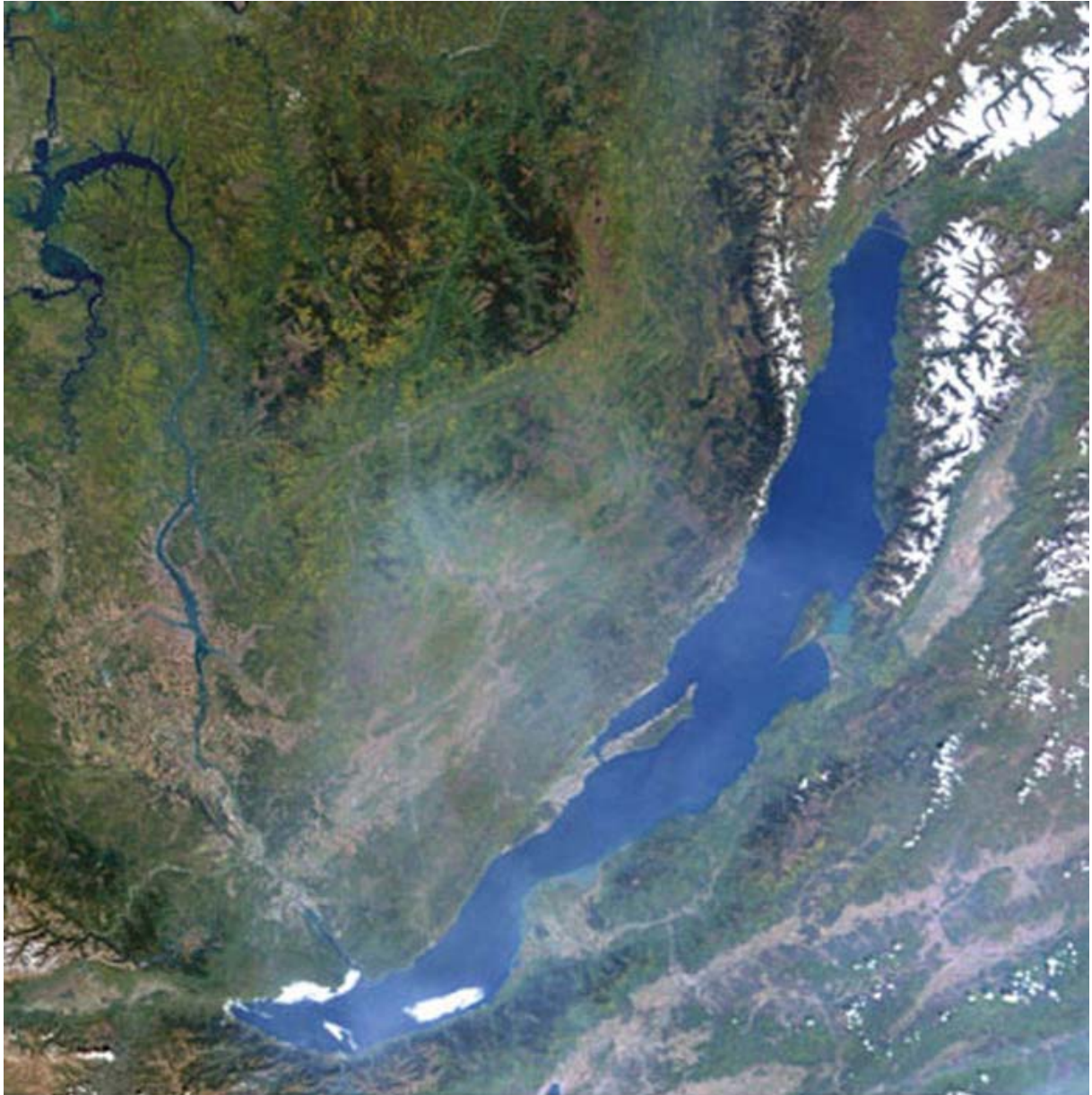
Le lac Baïkal vu de l'espace au cours des saisons (été : août)