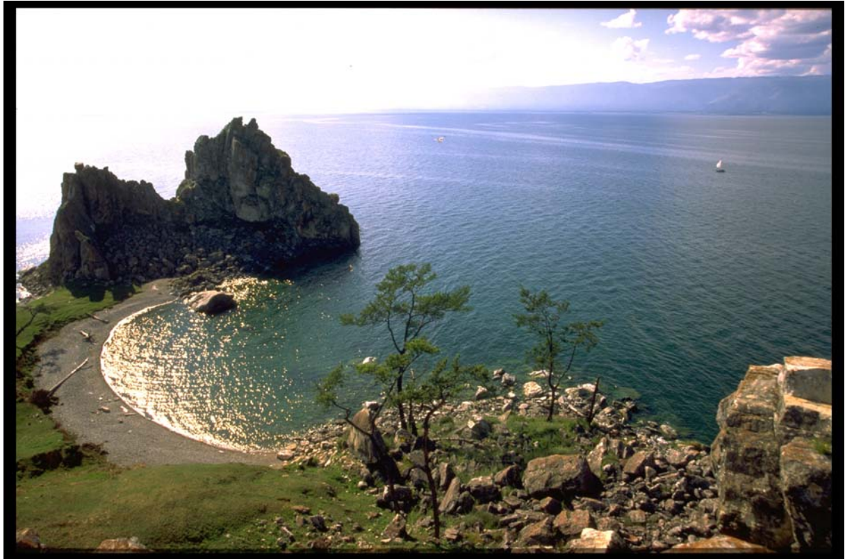
Le lac Baïkal