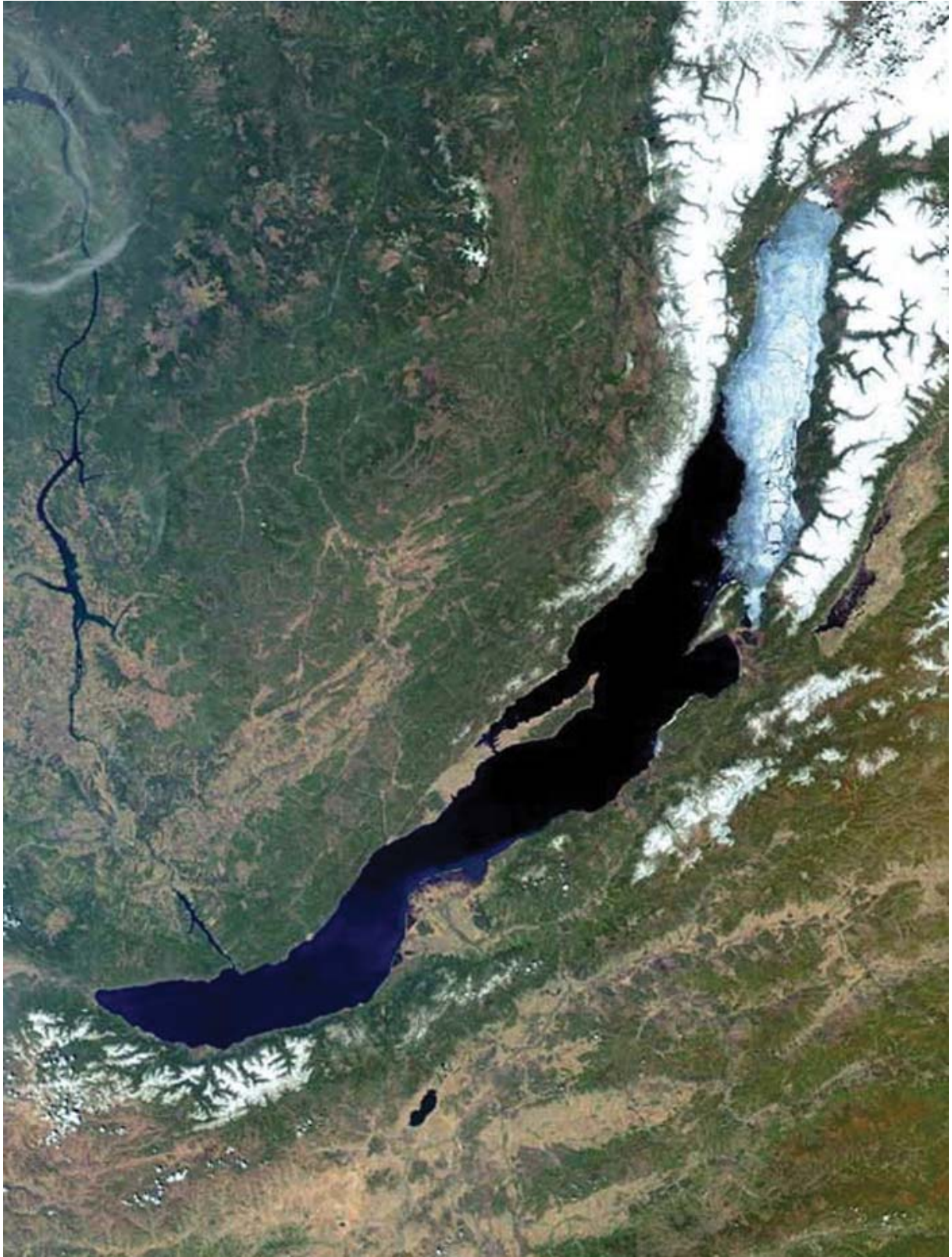
Le lac Baïkal vu de l'espace au cours des saisons (printemps : fin mai)