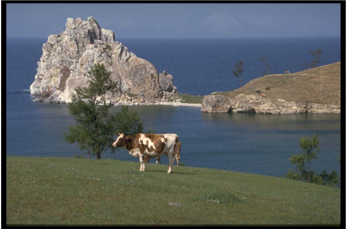
Le lac Baïkal