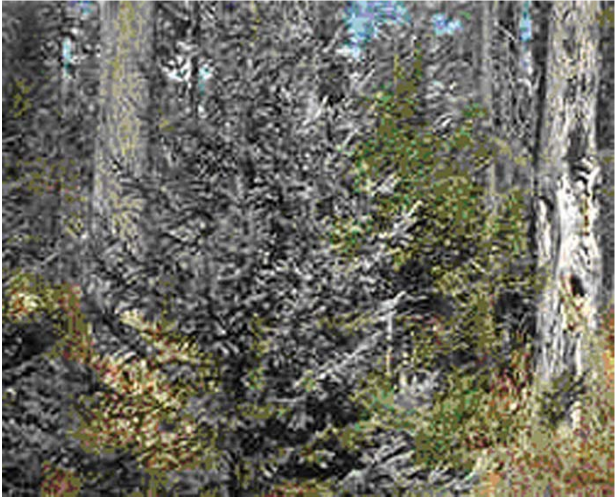
Le lac Baïkal est entouré de nombreuses forêts de conifères.