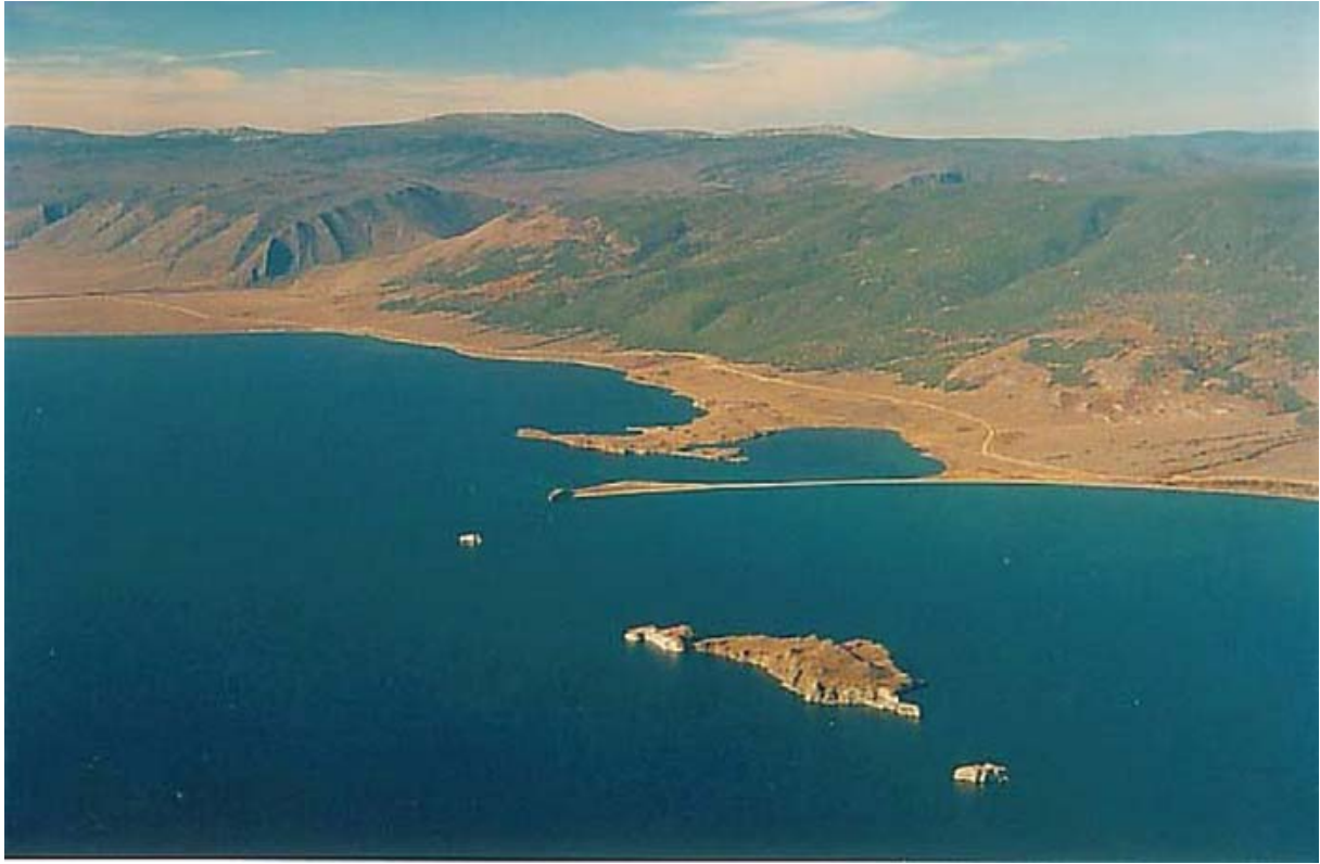
Le lac Baïkal, les îles Boraktchine sur Mala More